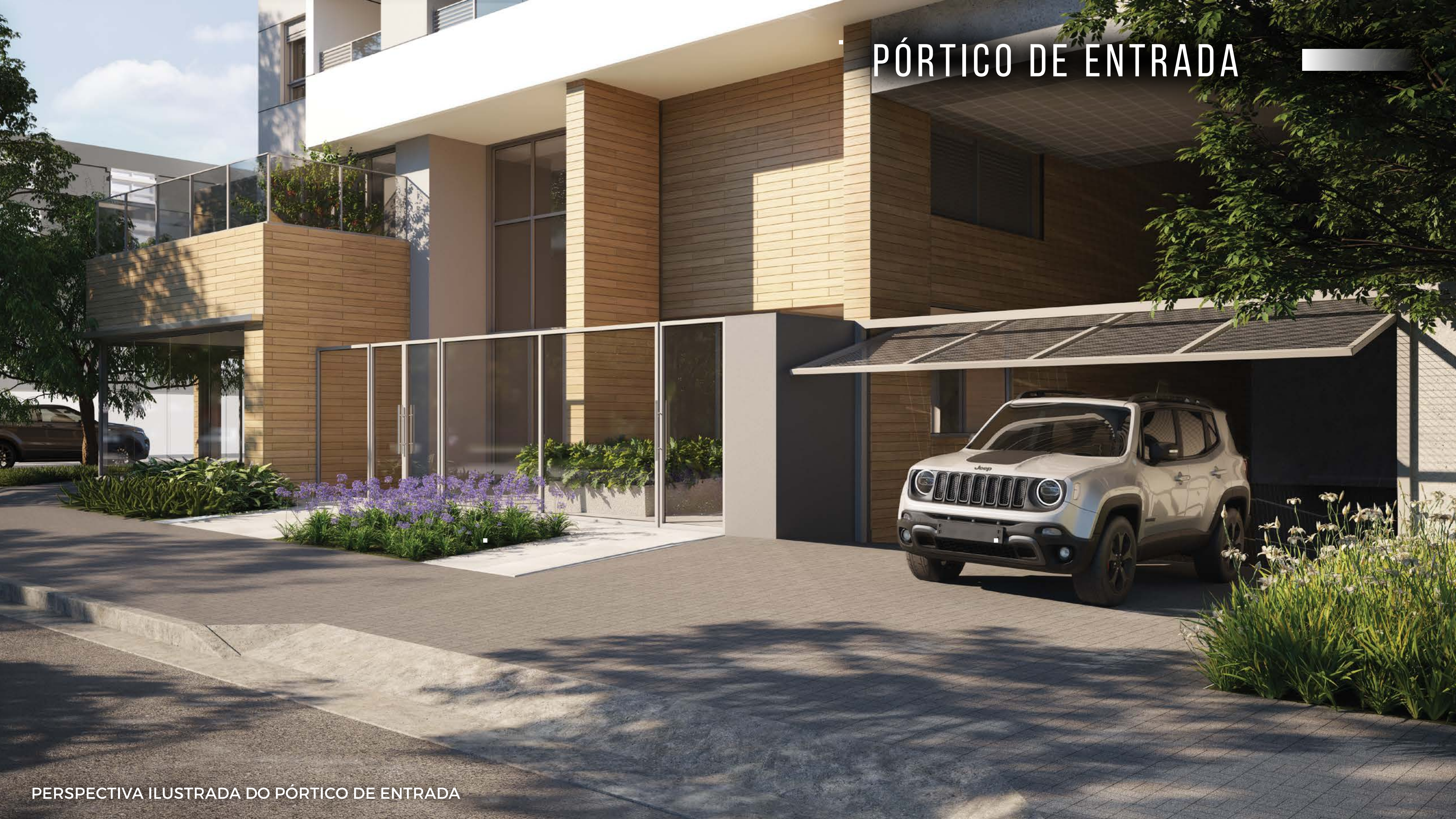
PERSPECTIVA ILUSTRADA DO PÓRTICO DE ENTRADA