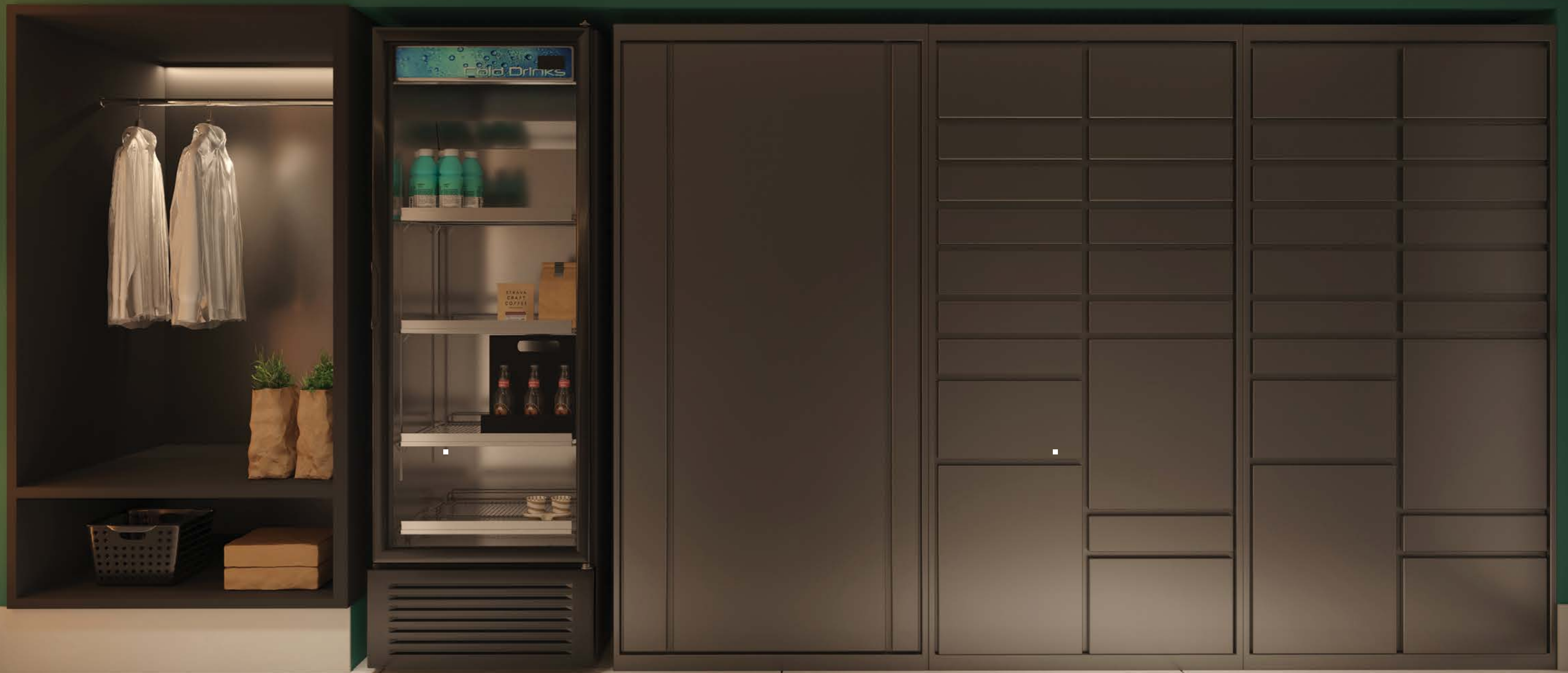
PERSPECTIVA ILUSTRADA DO LOCKER FOOD RESIDENCIAL