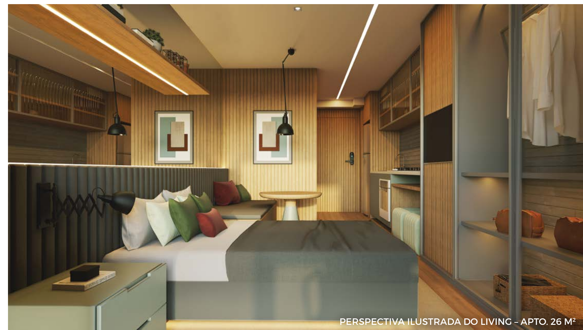
PERSPECTIVA ILUSTRADA DO LIVING - APTO. 26 M 2