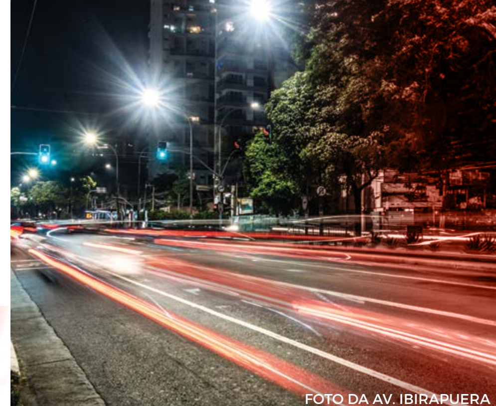
FOTO DA AV. IBIRAPUERA

É TEMPO DE VIVER MOEMA POR UM TODO, A CADA MOMENTO.