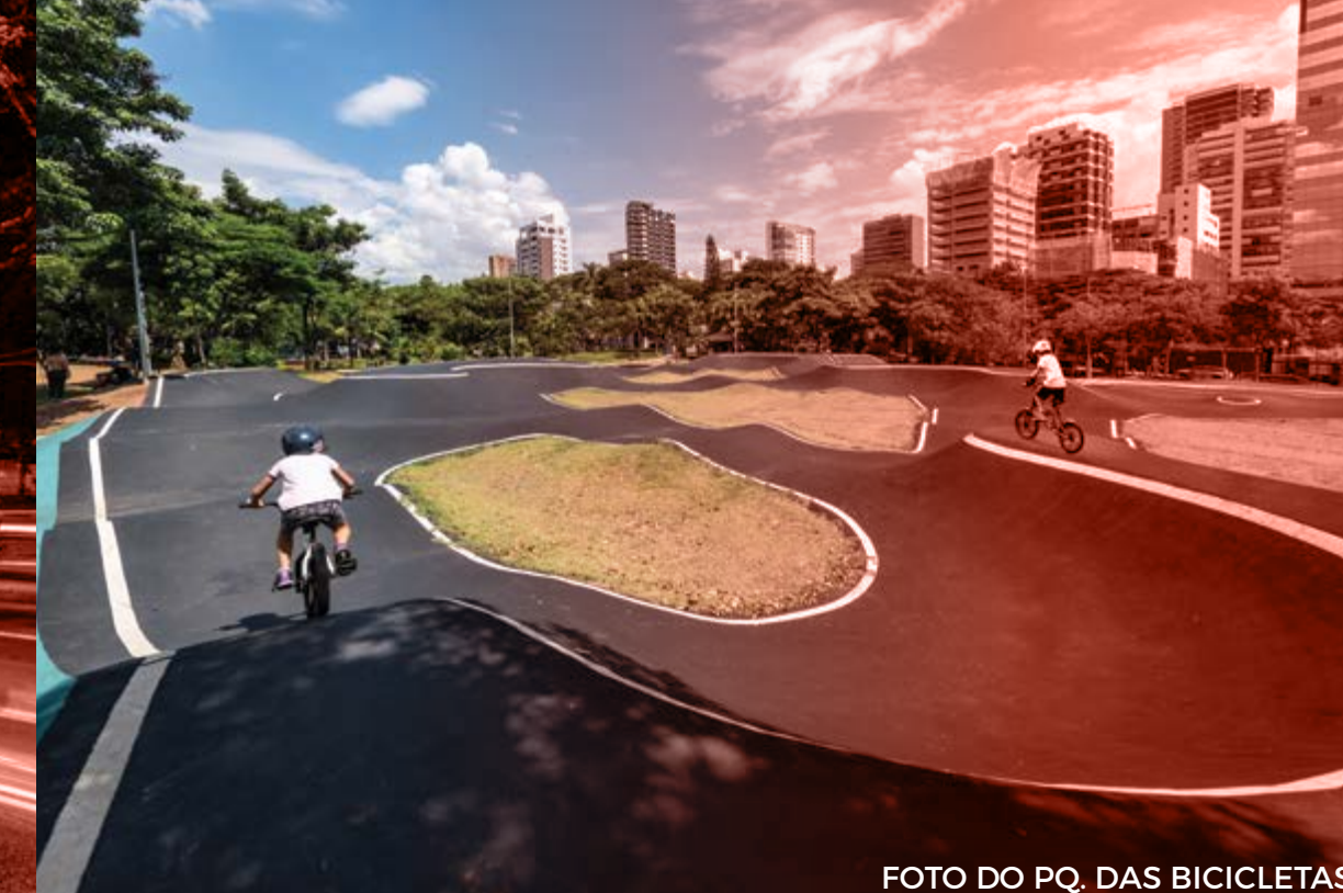
FOTO DO PQ. DAS BICILETAS

ACADEMIAS RESTAURANTES BARES FÁCIL ACESSO