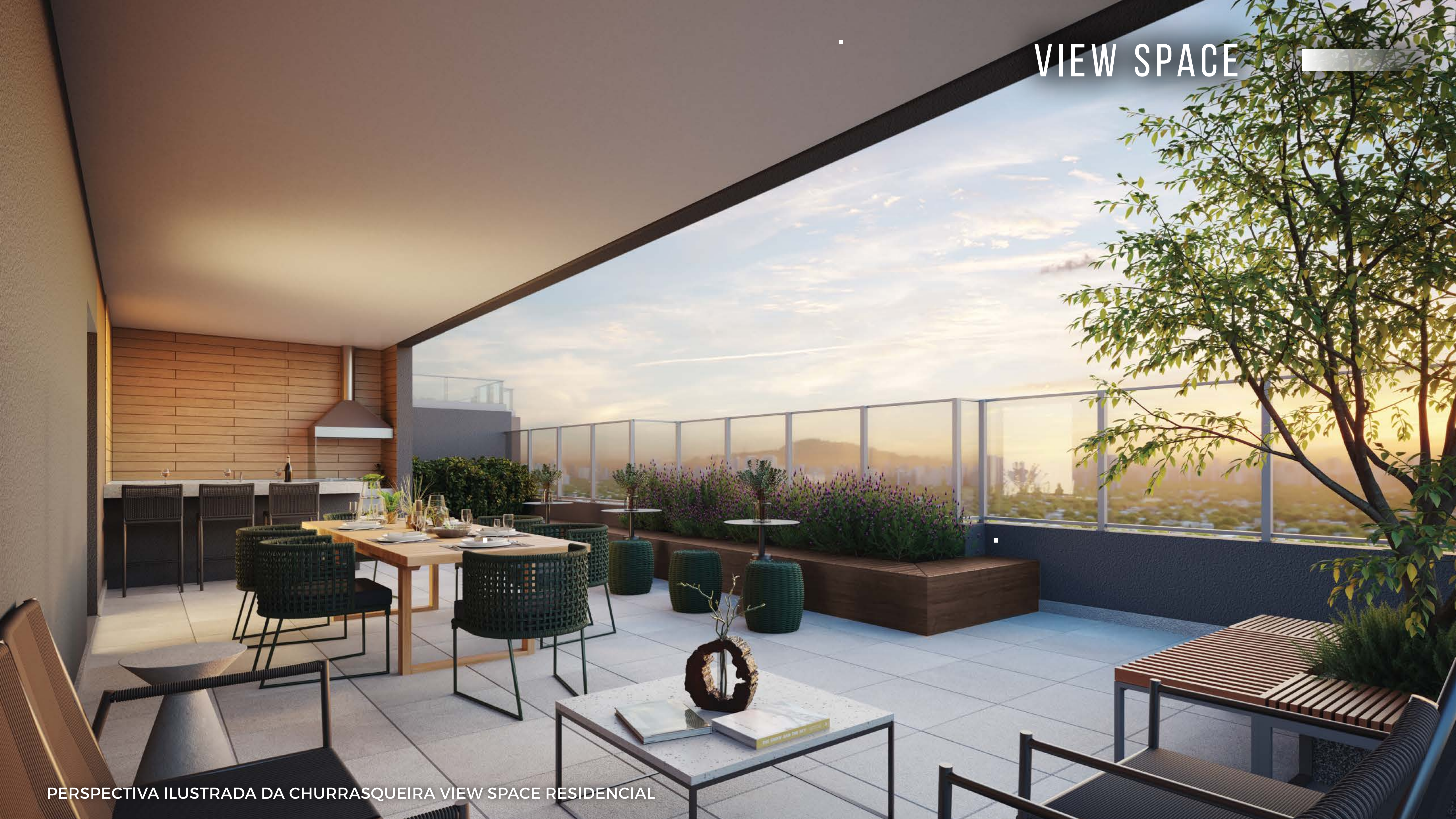
PERSPECTIVA ILUSTRADA DA CHURRASQUEIRA VIEW SPACE RESIDENCIAL