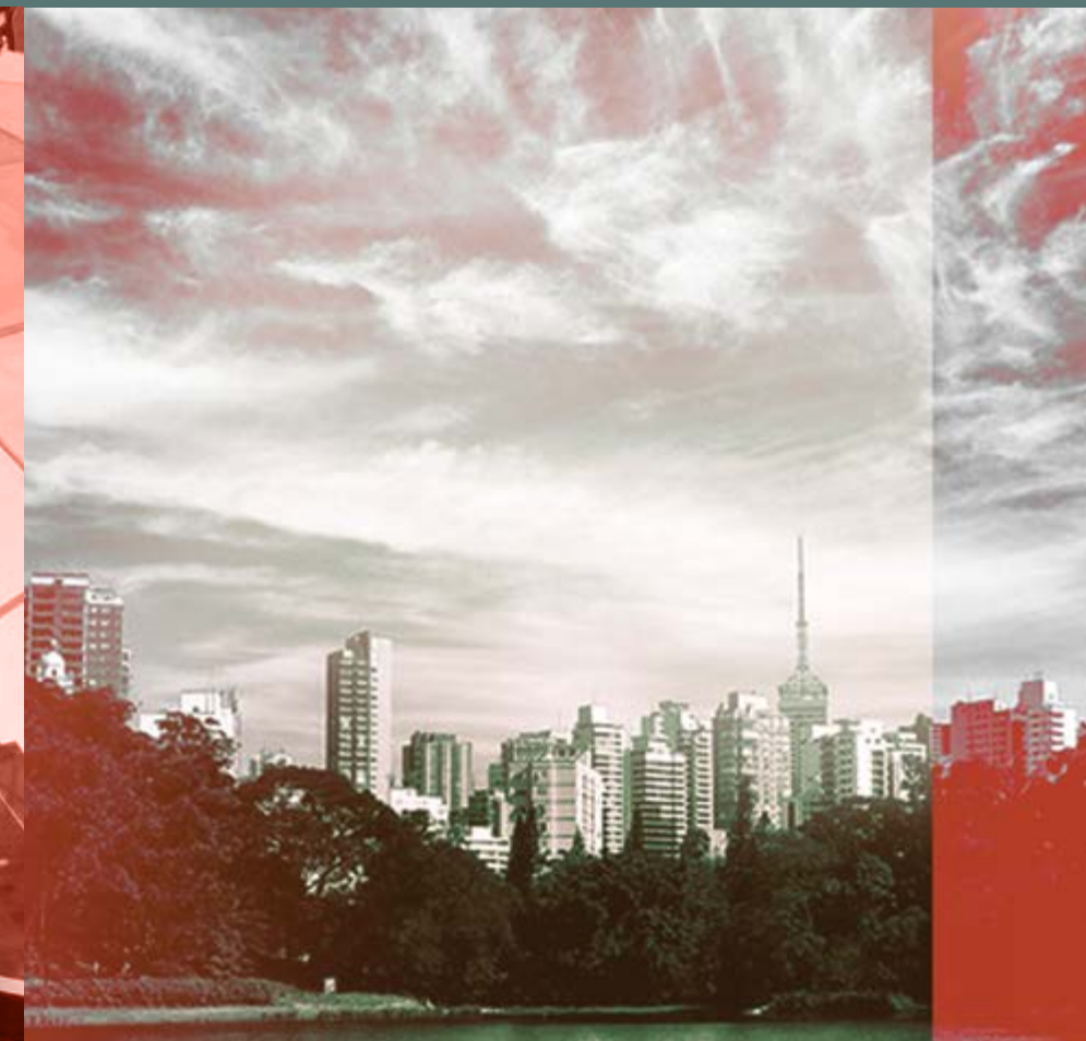
FOTO DO PQ. IBIRAPUERA

Para facilitar, o Shopping Ibirapuera a poucos passos e toda a conveniência da região, com bares, restaurantes e comércio. Para respirar, o Parque Ibirapuera, com todo o verde em seu caminho.