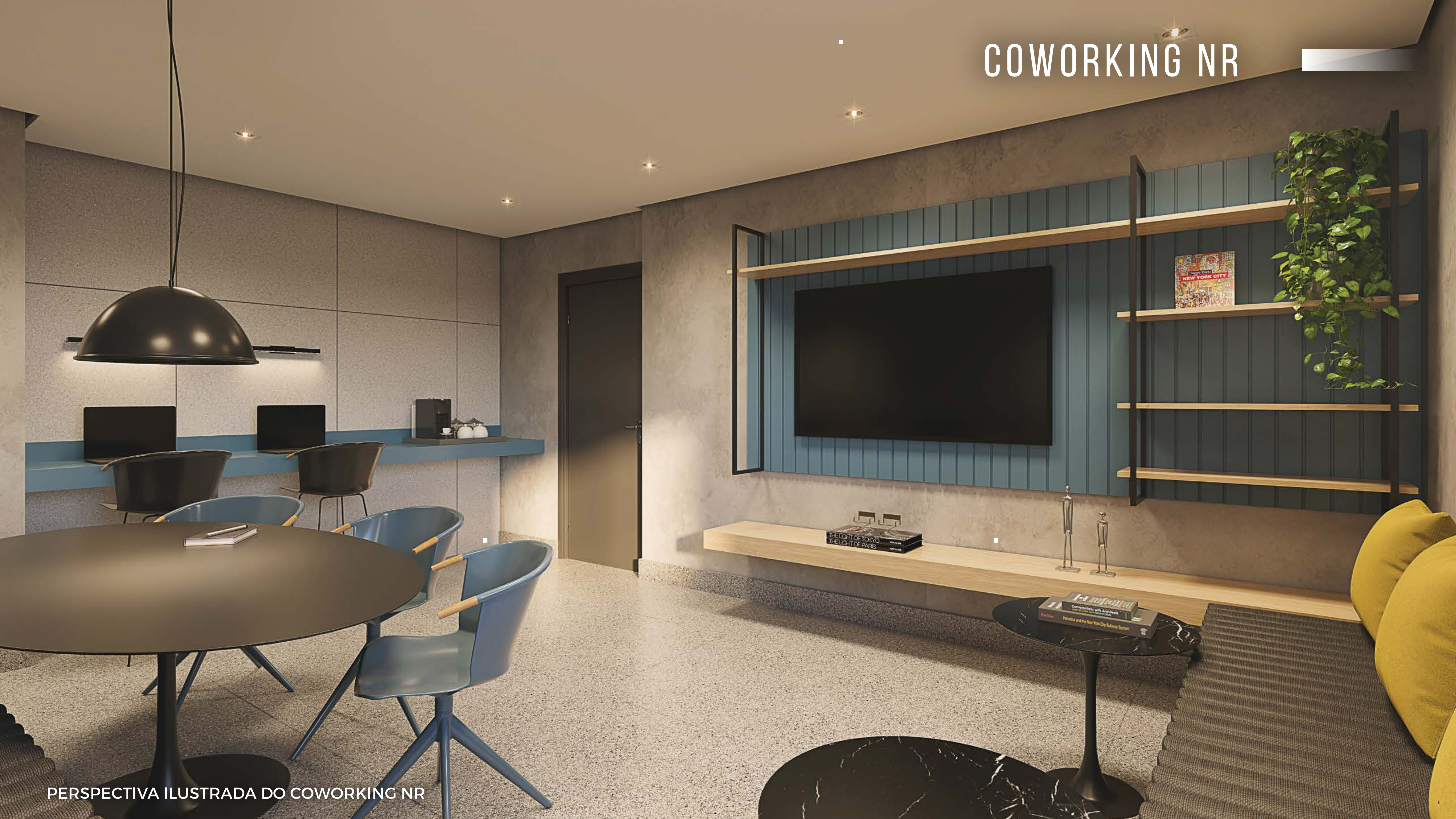
PERSPECTIVA ILUSTRADA DO COWORKING NR