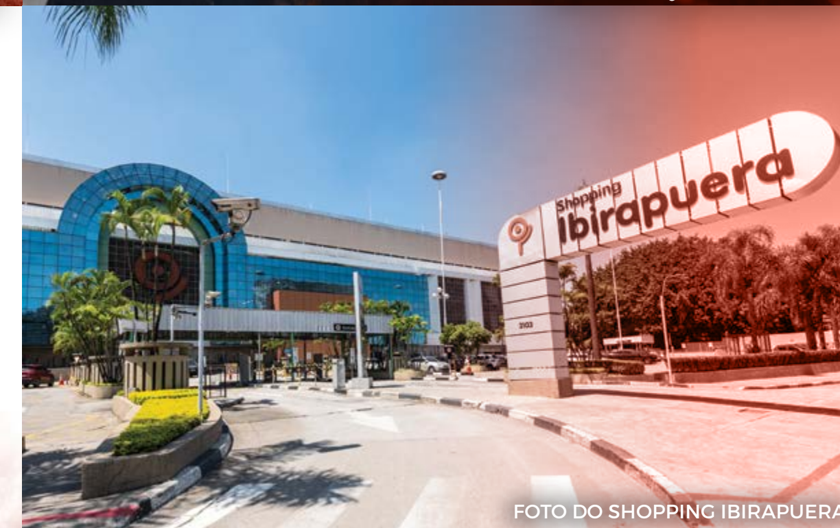
FOTO DO SHOPPING IBIRAPUERA